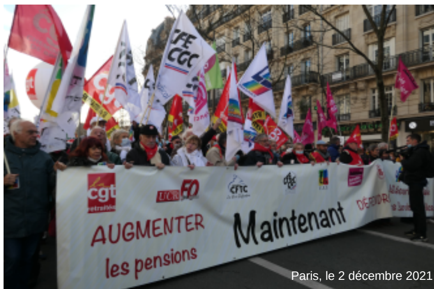
Paris, le 2 décembre 2021